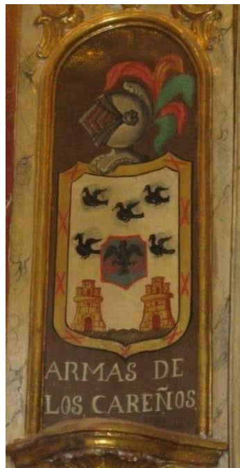
Altar de los Carreño en la Iglesia de la Concepción, Cehegín.

El escudo primitivo de los Prendes son cinco cuervos en aspa, única familia que mantuvo este escudo en el Concejo de Carreño, ya que las demás familias descendientes de los Cuervos, como es el caso de los Arango, que utilizaban seis cuervos.