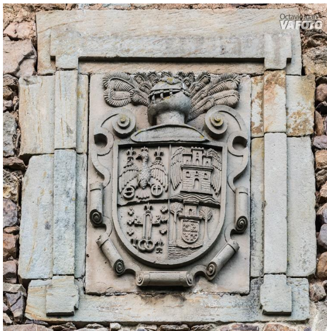
Escudo del Palacio de los Carreño en Sebades, Concejo de Carreño, con las armas de Carreño, Alas, Quirós y Casamayor.